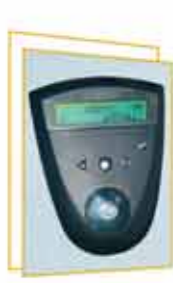
LCD kijelzős programkapcsoló