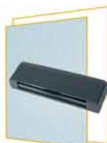
Aktív infravörös biztonsági fotocellák