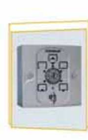
6 állású kulcsos programkapcsoló